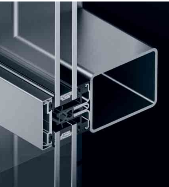
Schüco FW 50+ AOS Detailansicht Schüco FW 50+ AOS Detail view