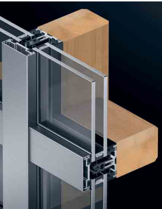
Schüco FW 50+ AOT Detailansicht Schüco FW 50+ AOT Detailansicht